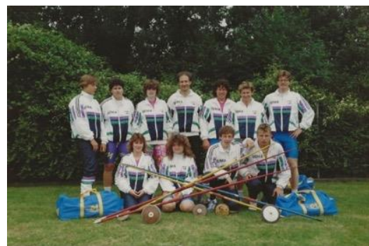
LVL-Werferteam vor dem Einsatz am Wurfcup in Kirchberg