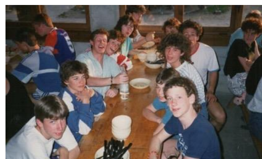
Fröhliche Teilnehmer im Tenerolager (ca. 1990)