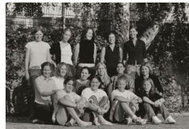
SVM-Frauenteam ca. 2000