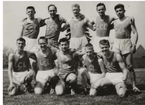
LCL-Team Ende 70er-Jahre

Fotos aus früheren Zeiten - Wer erkennt sie noch, die Cracks aus LCL und den frühen LVL-Zeiten?