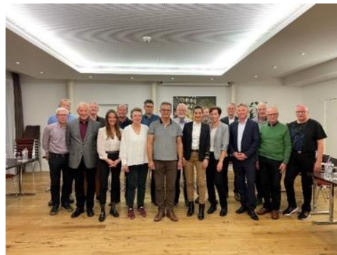
Das erweiterte SM-OK anlässlich der Schlussitzung vom 27.10.

Der Vorstand hat von der Auflösung des OKs Kenntnis genommen und die grosse und erfolgreiche Arbeit verdankt. Über das genaue Ergebnis wird an der ordentlichen VV vom 17. März 2022 informiert.