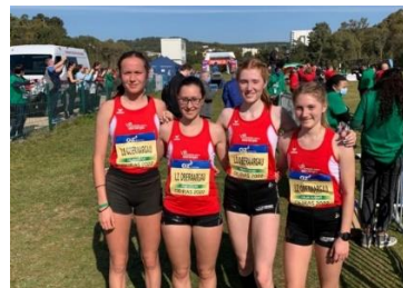
Ein junges LZO-Team klassiert sich am Club Cross Europacup auf dem guten 13. Rang!