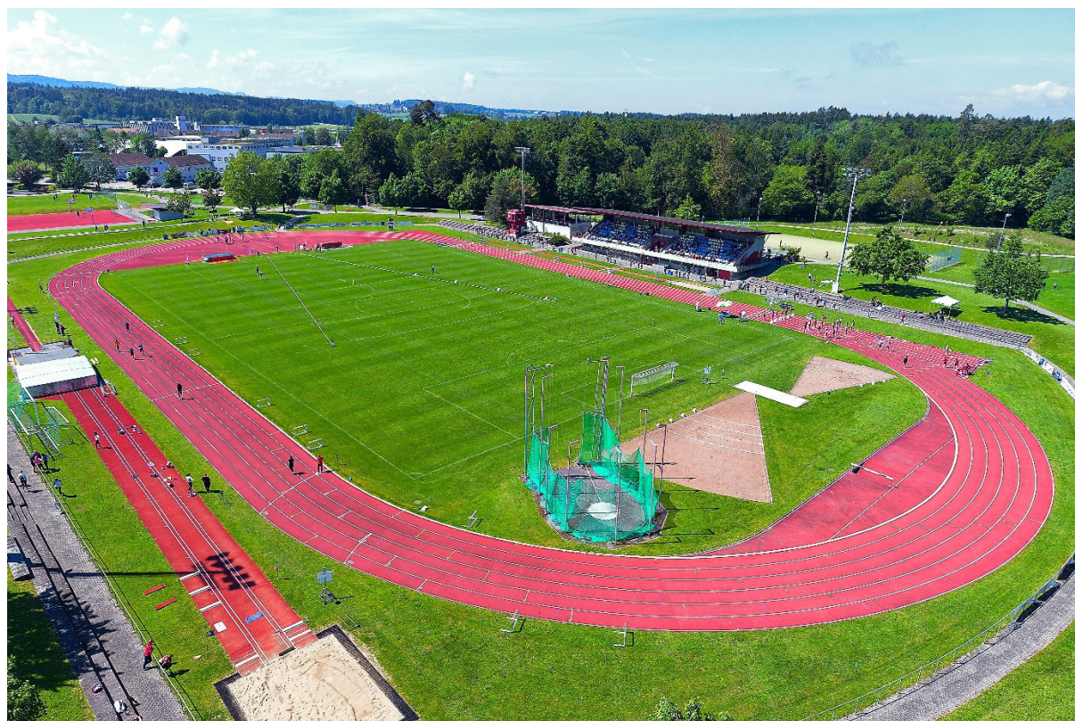
Stadion Hard aus der Drohnen-Perspektive